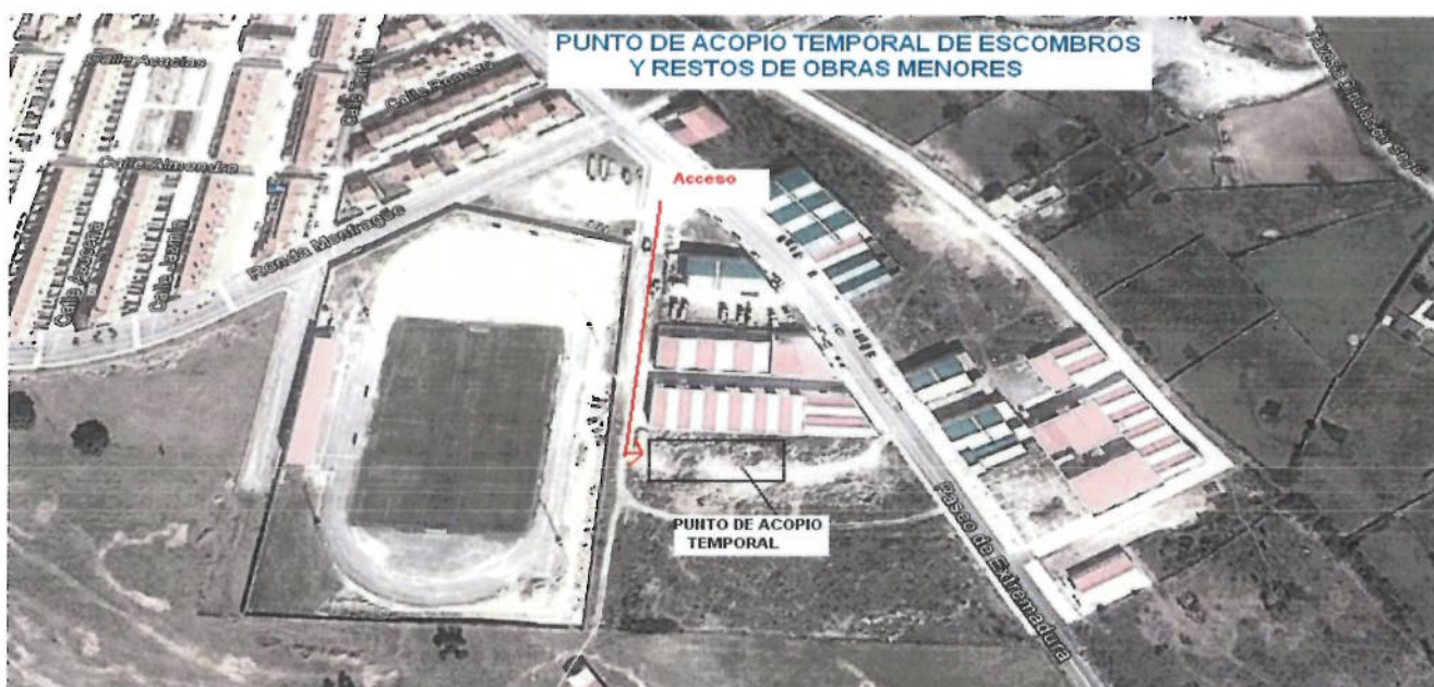
Punto de Acopio Temporal del Ayuntamiento de Malpartida de Plasencia

Una vez depositados los escombros y restos de obras menores en el Punto de Acopio Temporal, el Ayuntamiento los trasladará a la Planta de Reciclaje de Plasencia, donde se clasificarán, separando los materiales más voluminosos mediante medios manuales y mecánicos, valorándose los distintos materiales, según su naturaleza (tierras, hormigones, cemento, etc.), separándose los materiales que no son aptos para la cadena de reciclaje. Después se machacarán los residuos y a continuación se cribarán para su clasificación. El material resultante podrá ser reutilizado en obras de construcción, tales como hormigones, caminos, terraplenes, relleno, drenajes, jardinería, camas de tuberías, etc.